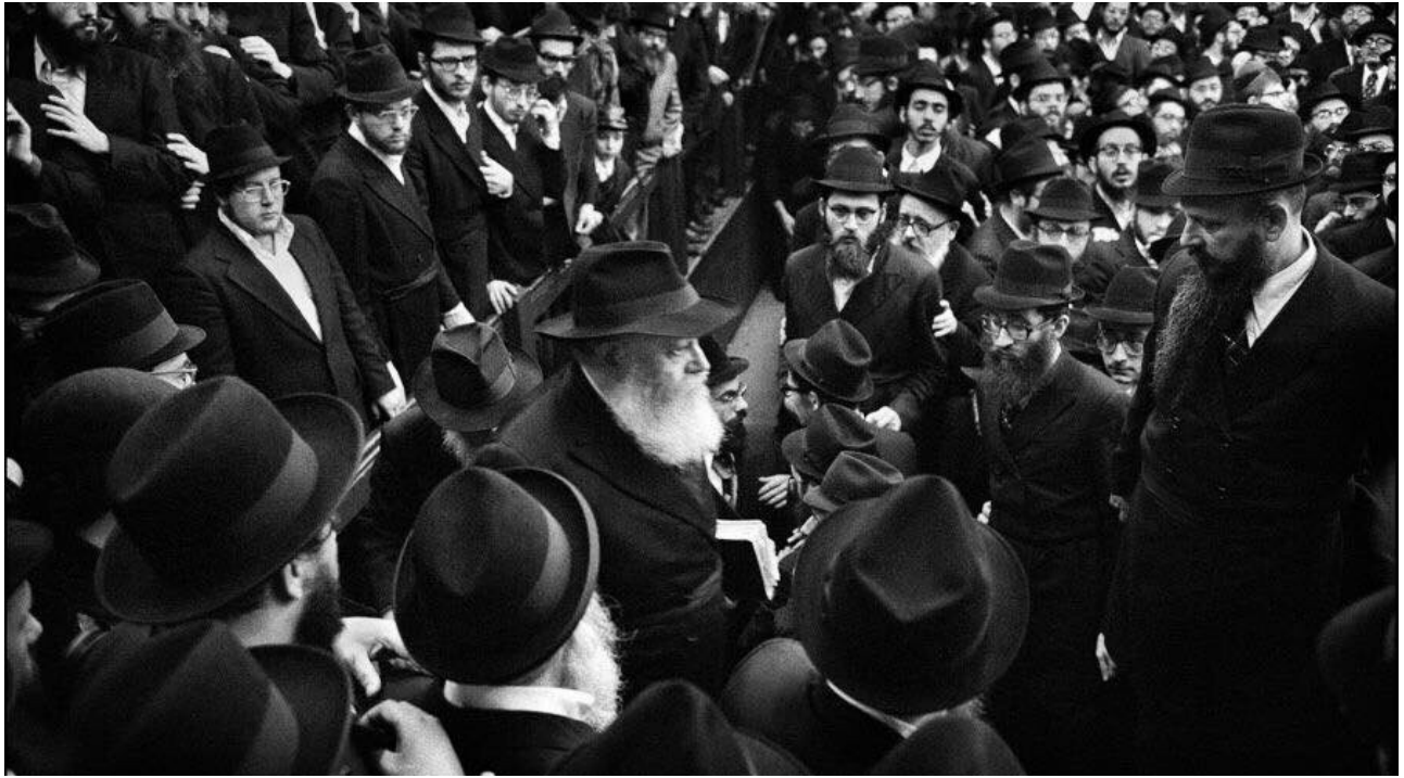
הרבי העריך את אבי בין השאר בגלל היותו איש עשייה. הרב חפר ז"ל על בימת ההתוועדות בעת שהרבי נכנס לבית המדרש להתוועדות

המילה. ואכן, כל חייו הוקדשו לעשייה בלתי פוסקת.