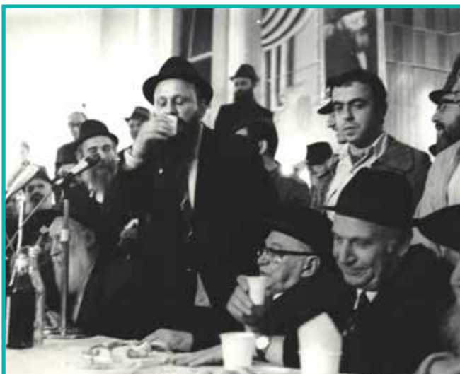
הנחה את אירועי חב"ד. הרב חפר ז"ל מנחה את חגיגת י"ט כסלו בכפר חב"ד. לשמאלו, נשיא המדינה מר זלמן שזר וממלא מקומו בתפקיד פרופ' אפרים קציר

בסוף החודש, קודם שובי ארצה נכנסתי ל'יחידות' פעם שנייה. ה'יחידות' הזאת הייתה ארוכה ונפלאה מאוד. היא ארכה קרוב