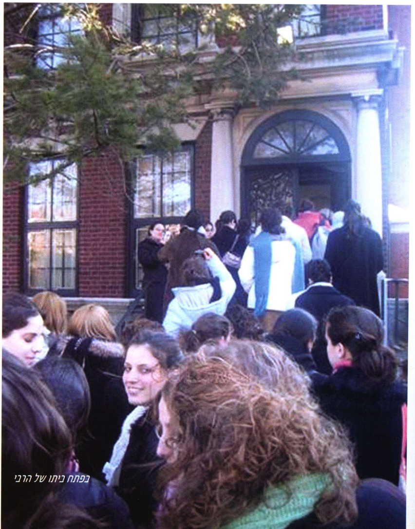
בפתח ביתו של הרבי

"לאחר זמן מה, חל רפיון בפעילותי בעניין. הדבר נבע מן הקשיים הטכניים והלוגיסטיים שניצבו בדרכי. ברוב המקרים, לא היו לנוסעים בני משפחה המתגוררים בקרבת חצר הרבי, כך שהיה עלי להשיג מקומות כמאתיים לינה לכמאתיים איש – משימה קשה וכמעט בלתי אפשרית. אנשים רבים סייעו לי במשימה זו, אך גם הם הרימו ידיים. החלטתי אפוא להפסיק עם הנסיעות למרות חשיבותן הרבה.