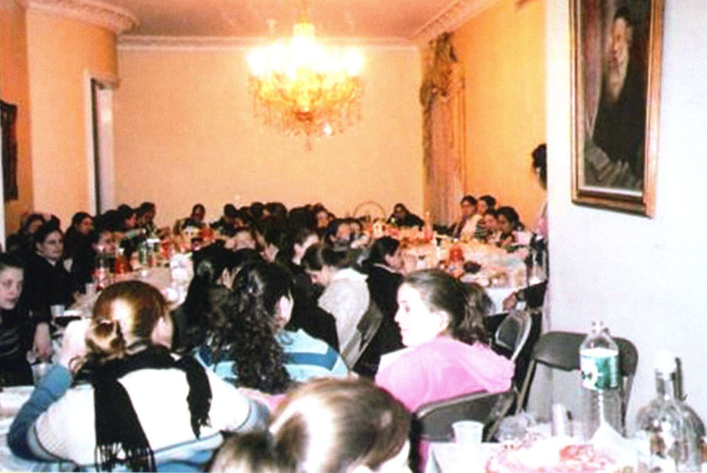
התועדות בבית משפחת רובשקין

השלוחים הוא הכוונה האמיתית הטמונה בליקוטי תורה". תכלית הכוונה היא שרואים את השלוחים בפועל ממש בעבודת הקודש".