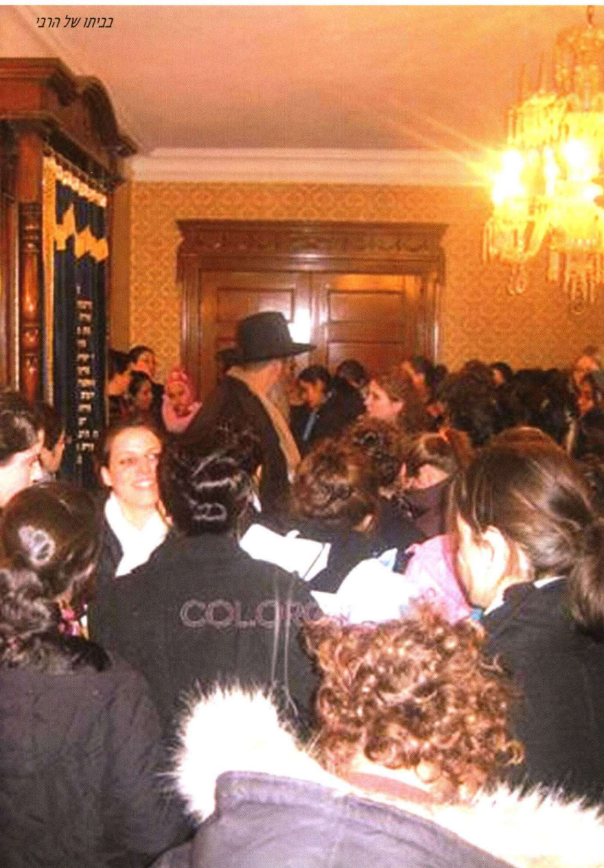
ביתו של הרבי

"הביקור בביתו של הרבי", מוסיפה רייזי, כשהיא נדרשת לפרטים, "בחדרו של הרבי ובביתו של הרבי הרי"צ, הותירו בי רושם אדיר".