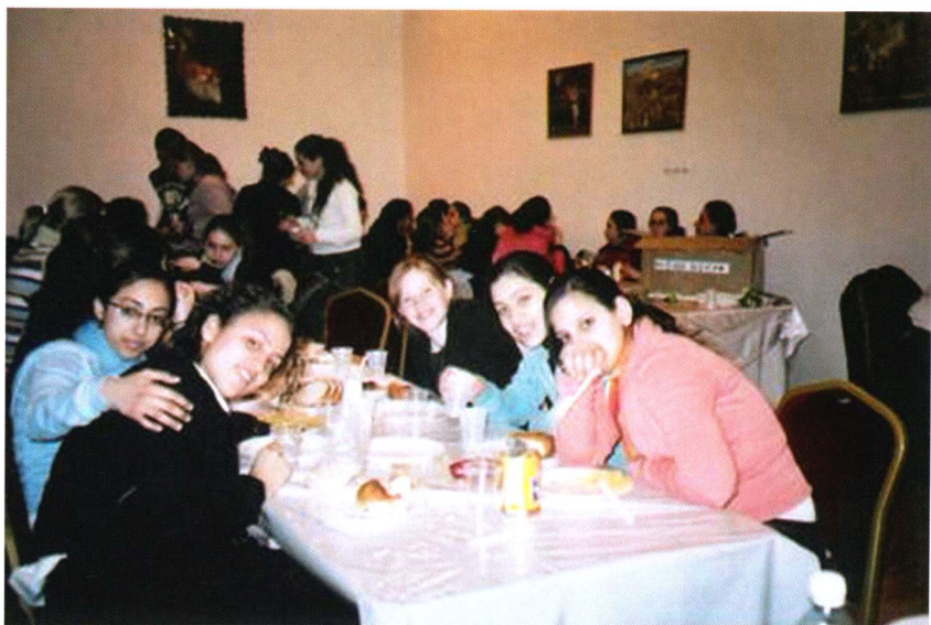
התועדות בהונגריה לפני הטיסה לארץ

"מיד בעלותנו למטוס נכנסנו לתוך התועדות ארוכה שנמשכה על פני שבועיים. כל התועדות נשאה אופי שונה והיא תרמה תרומה מכרעת בהתקשרות שלי לרבי"